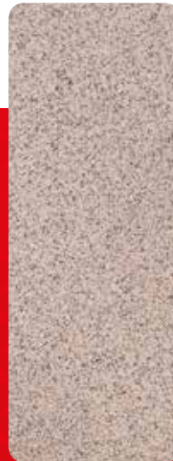
Mehrschichtig ohne definierte Anordnung.