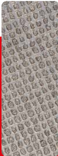
Mehrschichtig in Gruppen definierte Anordnung.