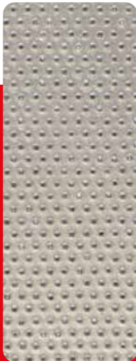
Einschichtig definierte Anordnung.

Entwickeln Sie gemeinsam mit uns das präzise, auf Ihre Anforderungen zugeschnittene Produkt.