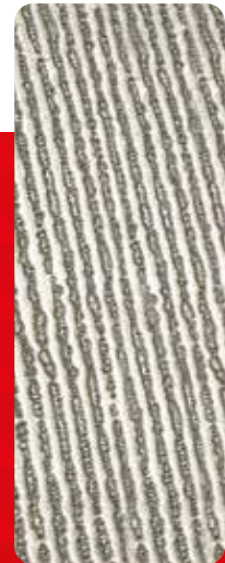
Mehrschichtig in Spuren definierte Anordnung.