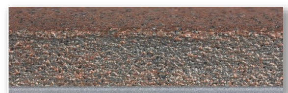
Mehrschichtig ohne definierte Anordnung