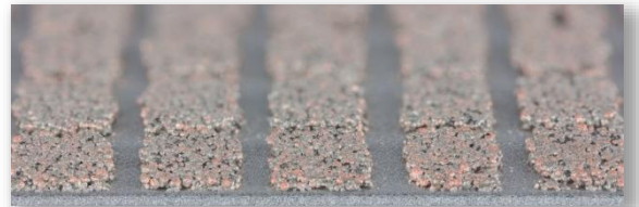
Mehrschichtig in Gruppen definierte Anordnung