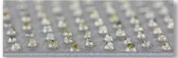
Einschichtig definierte Anordnung