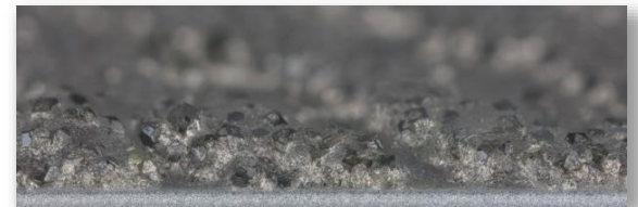
Mehrschichtig in Spuren definierte Anordnung